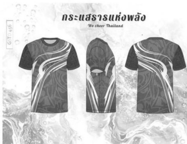
ลวดลายร่วมสมัยผลงาน "กระแสร่างห่วงล้อ"