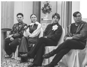
คณะกรรมการตัดสินเวทีประกวดนักออกแบบรุ่นเยาว์