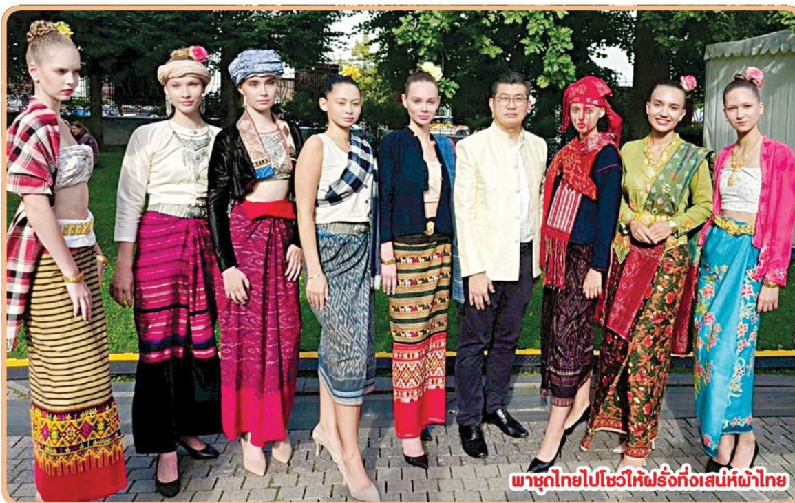
พาชุดไทยไปโชว์ให้ฝรั่งทึ่งเสน่ห์ผ้าไทย