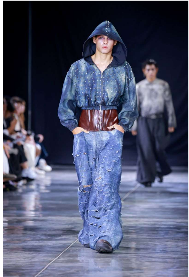
สาขาวิชาศิลปะการออกแบบแฟชั่นราภรณ์ คณะศิลปกรรมศาสตร์ มหาวิทยาลัยธรรมศาสตร์

สาขาวิชาศิลปะการออกแบบแฟชั่นราภรณ์ คณะศิลปกรรมศาสตร์ มหาวิทยาลัยธรรมศาสตร์ ภายใต้แนวคิด “GENESIS” สื่อถึงจุดเริ่มต้นของการเติบโต การเรียนรู้ และการค้นพบตัวตนของนักออกแบบรุ่นใหม่ ผ่านผลงานที่สะท้อนพัฒนาการทางความคิดและทักษะ