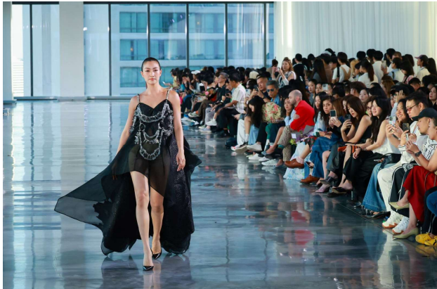
ภาควิชาการออกแบบแฟชั่น คณะศิลปกรรมศาสตร์ มหาวิทยาลัยกรุงเทพ

สาขาวิชาศิลปะการออกแบบแฟชั่นราภรณ์ คณะศิลปกรรมศาสตร์ มหาวิทยาลัยธรรมศาสตร์ ภายใต้แนวคิด “GENESIS” สื่อถึงจุดเริ่มต้นของการเติบโต การเรียนรู้ และการค้นพบตัวตนของนักออกแบบรุ่นใหม่ ผ่านผลงานที่สะท้อนพัฒนาการทางความคิดและทักษะ