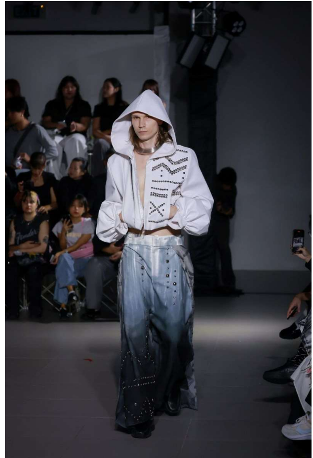
คณะศิลปกรรมศาสตร์ มหาวิทยาลัย ศรีนครินทรวิโรฒ

คณะศิลปกรรมศาสตร์ มหาวิทยาลัย ศรีนครินทรวิโรฒ ภายใต้แนวคิด “Activism Thai Modern” นำเสนอการตีความอัตลักษณ์ความเป็น ไทยในบริบทสมัยใหม่ ผ่านการผสมผสานวัฒนธรรม ดั้งเดิมเข้ากับแนวคิดร่วมสมัย เพื่อสะท้อนบทบาท ของแฟชั่นในฐานะเครื่องมือสื่อสารทางสังคม