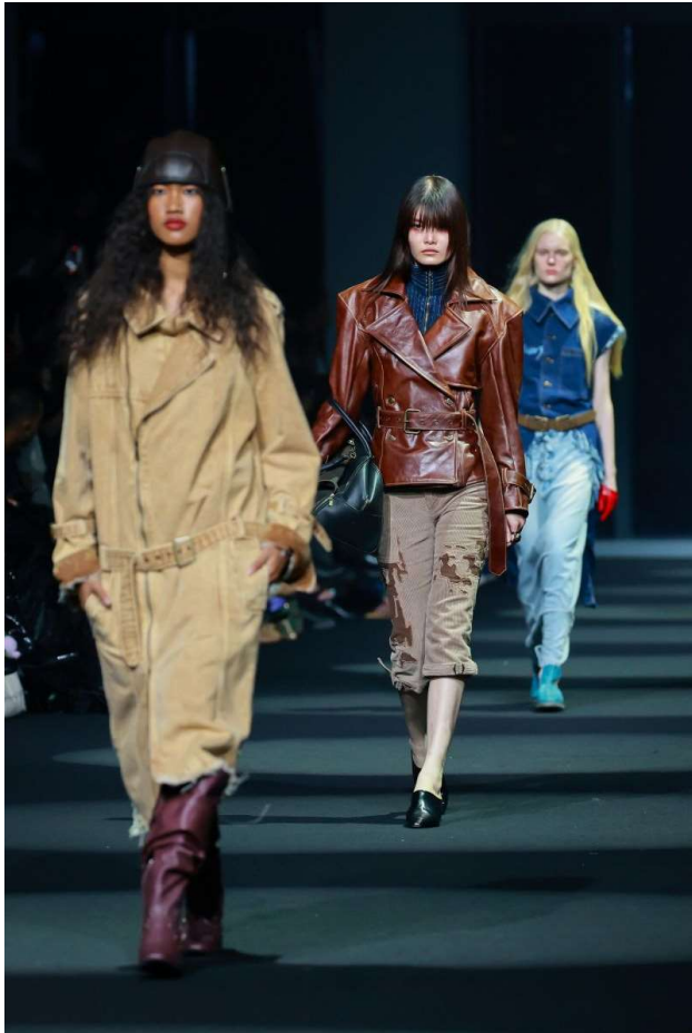
หลักสูตรแฟชั่น สิ่งทอ และเครื่องตกแต่ง วิทยาลัย อุตสาหกรรมสร้างสรรค์ มหาวิทยาลัย ศรีนครินทรวิโรฒ

คณะศิลปกรรมศาสตร์ มหาวิทยาลัย ศรีนครินทรวิโรฒ ภายใต้แนวคิด “Activism Thai Modern” นำเสนอการตีความอัตลักษณ์ความเป็น ไทยในบริบทสมัยใหม่ ผ่านการผสมผสานวัฒนธรรม ดั้งเดิมเข้ากับแนวคิดร่วมสมัย เพื่อสะท้อนบทบาท ของแฟชั่นในฐานะเครื่องมือสื่อสารทางสังคม