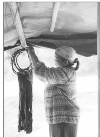
พลังช่างทอยังคงสืบสาน ช่างฝีมือย้อมสีธรรมชาติ

ภู มิปัญญาช่างฝีมือย้อมสีธรรมชาติ ในสามจังหวัดชายแดนใต้ ชื่อยี่ห้อของกลุ่มทอผ้าไหมบ้านภูเขาทอง อำเภอสุคิริน จังหวัดนราธิวาส ติดอันดับต้นๆ มีจุดเด่นเรื่อง “ไหมอีรี” หนึ่งในเดียวในภาคใต้ ยิ่งกว่านั้นชุมชนสามารถย้อมสีธรรมชาติได้หลากหลายโทนสี เหตุนี้ ทีมกรมส่งเสริมวัฒนธรรมกับศูนย์บริการวิชาการ มหาวิทยาลัยศรีนครินทรวิโรฒ ลงพื้นที่กิจกรรมการรวบรวมและเผยแพร่องค์ความรู้ : ช่างฝีมือย้อมสีธรรมชาติ ภายใต้โครงการพัฒนามรดกภูมิปัญญาทางวัฒนธรรมผ้าไทยสู่สากล ประจำปี 2569 ซึ่งสองหน่วยงานนี้มีการส่งเสริมความรู้จากหนังสือแนวโน้มและทิศทางผ้าไทยและการออกแบบเครื่องแต่งกายด้วยผ้าไทย (Thai Textiles Trend