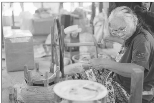
กลุ่มทอผ้าไหมบ้านภูเขาทอง มีชื่อเสียงจากไหมอีรี