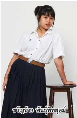
ขวัญข้าว พันธุ์พิทยุตม์