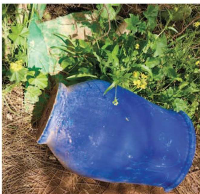
เซอร์ พอล สมิธ (Sir Paul Smith)