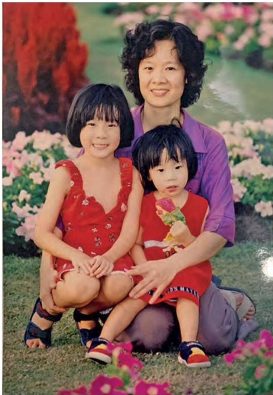
ครอบครัว “ณ สงขลา” ที่แสนอบอุ่น

“เขาบอกว่าจะได้เจอคุณแม่ค่ะ แต่เขาไม่ได้บอกว่าจะได้เห็นเป็น VR หรือว่าจะได้เห็นเป็นยังงั้ ตอนแรกที่โอเข้าใจคืออาจจะเหมือนของที่เกาหลีค่ะ ที่ใส่แล้วเห็นเขาเป็นภาพแบบ The Sims แค่นั้นโอก็ดีใจแล้ว