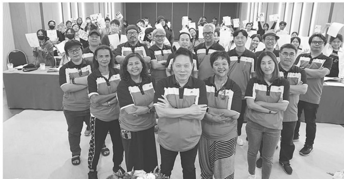
รวมนักเขียนการ์ตูนชั้นนำถ่ายทอดเทคนิค-ประสบการณ์