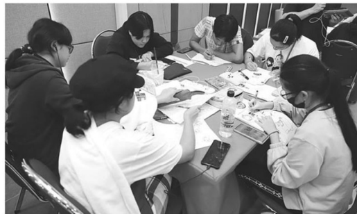
ค่ายการ์ตูนฯ สอนวาด ปลูกฝังทำงานเป็นทีม