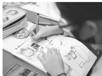
การวาดตัวการ์ตูนของเยาวชน

“ค าย 7-11 ถอดรหัสนักวาดการ์ตูนในฝัน ” เป็นกิจกรรมประจำปี จัดขึ้นเป็นรุ่นที่ 18 โดยสำนักกิจการเพื่อสังคมและสิ่งแวดล้อม บริษัท ซีพี ออลล์ จำกัด (มหาชน) ร่วมกับสมาคมการ์ตูนไทย และมหาวิทยาลัยศรีนครินทรวิโรฒ ภายใต้แนวคิด “ฝันใหม่ในโลกพลิกผัน (Dream and Disruption)” คำ