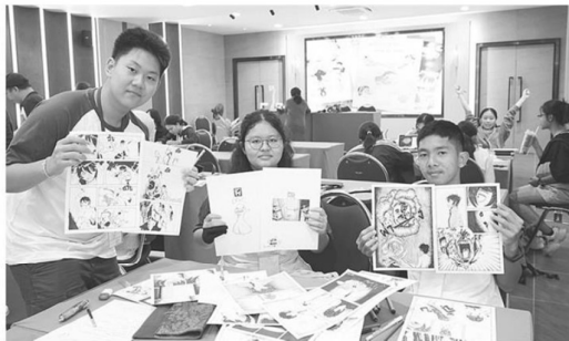
น้องๆ นักวาดการ์ตูนทำต้นฉบับการ์ตูนสวยงาม