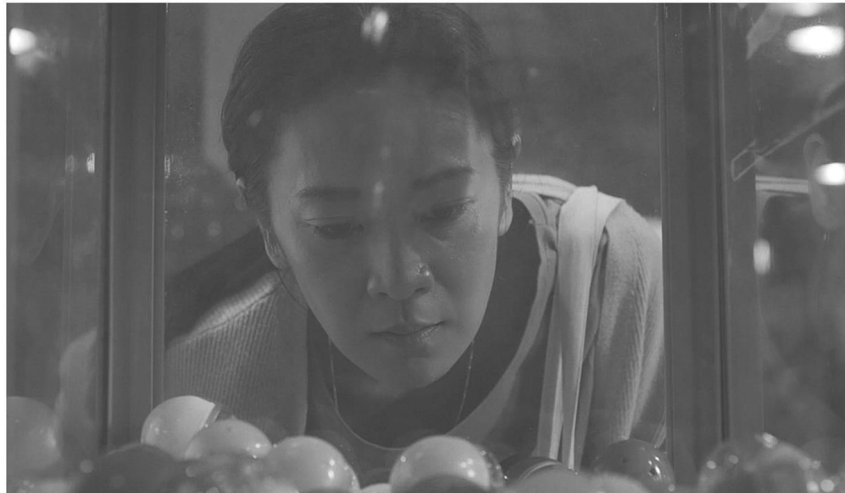
With Love, and Other Things หนังสือรางวัลช้างเผือก