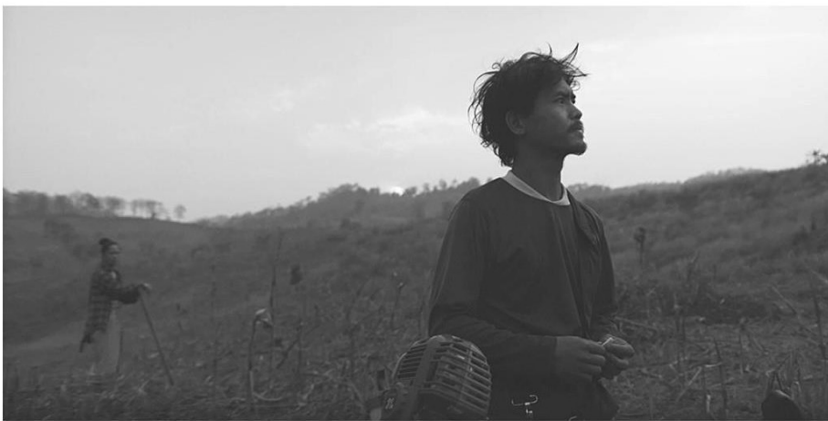
Please...See Us หน่งแสดงภพควมแรนคั้นชนกลุ่มน้อย

อนุรักษนิยมทงศศสนท โดย พิชญุตน์ เต้าอั้น ดำนรงวัลปยุต เงกระจำง ส่ำหรับหน่งแอนิเมชัน ผู้ชนะ ได้แก่ ด.ญ.ตั้งใจ โดย พร้ม สุรพักตร์ภิญญไญ และปัทมท หมมรอด