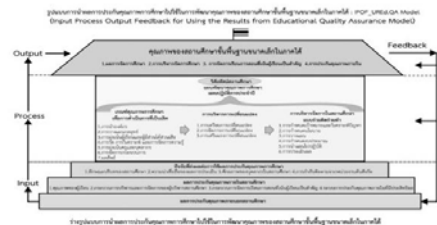
ตัวอย่างรูปแบบการนำเสนอ

2. รูปแบบการนำผลการประกันคุณภาพการศึกษาไปใช้ในการพัฒนาคุณภาพของสถานศึกษาขั้นพื้นฐานขนาดเล็กในภาคใต้ ได้มีแนวคิดและค่านิยมหลักของรูปแบบ คือ 1) การบริหารสู่ความเป็นเลิศของสถานศึกษา 2) การบริหารบนฐานของข้อมูลและสารสนเทศ 3) การตัดสินใจทางการบริหารตามผลการประเมิน 4) การรายงานผลลัพธ์การดำเนินงาน 5) การพัฒนาสถานศึกษาอย่างต่อเนื่อง กลไกและกระบวนการบริหารของรูปแบบประกอบด้วยขั้นตอนในการบริหารจัดการสถานศึกษาตามแนวคิดทฤษฎีระบบเป็น 3 ขั้นตอน คือ ปัจจัยนำเข้า (Input) กระบวนการ (Process) และผลผลิต (Output) พร้อมกับข้อมูลย้อนกลับ (Feedback) ซึ่งผู้ทรงคุณวุฒิและผู้เชี่ยวชาญ และผู้ปฏิบัติที่เป็นผู้บริหารสถานศึกษา