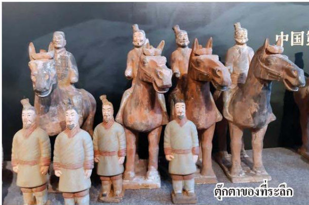
ตุ๊กตาของที่ระลึก