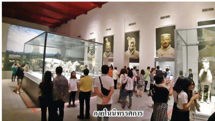
ภายในพิพิธภัณฑ์