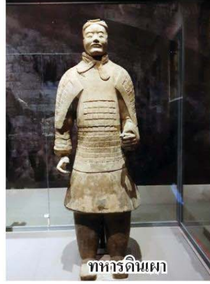
ทหารดินเผา