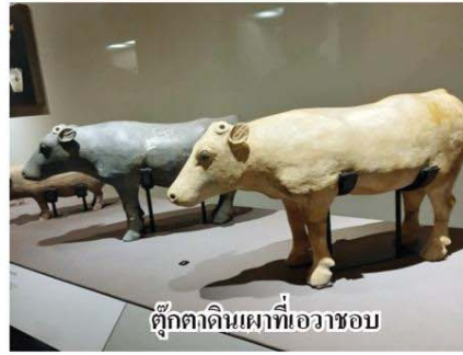
ตุ๊กตาดินเผาที่เอวชอบ

โรงเรียนสาธิตมหาวิทยาลัยศรีนครินทรวิโรฒประสานมิตร (ฝ่ายมัธยม) บอกว่า ชอบหุ่นทหารดินเผาของจริงและดินเหนียวกับป้ายที่มีชื่อ “ราชวงศ์หมิง” เพราะตรงกับชื่อเล่นจึงไปยื่นถ่ายรูปด้วยคุณแม่ของหมิงซึ่งจบการศึกษาเอกภาษาจีน อธิบายให้ฟังว่าอักษรจีนคำว่า “หมิง”