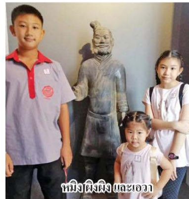
หมิงผิงผิง และเอวา