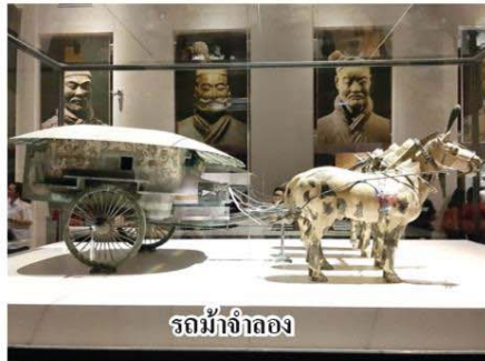
รถม้าจำลอง