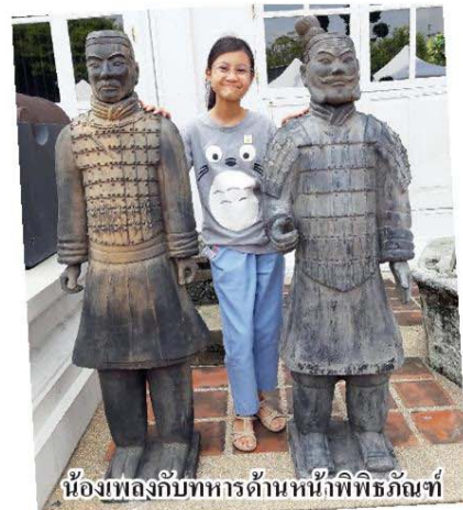
น้องเพลงกับทหารด้านหน้าพิพิธภัณฑ

นิทรรศการจัดแสดงวันนี้ถึงวันที่ 25 ธ.ค. นี้ ค่าเข้าชม คนไทย 30 บาท นักเรียนนักศึกษาชมฟรี ของดีมีให้ดูใกล้ๆ ไม่ต้องไปอิงเมืองจีน