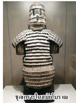
ชุดเกราะในสมัยโบราณ