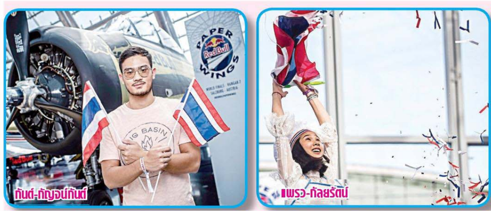
กันต์-กัญจน์กันต์