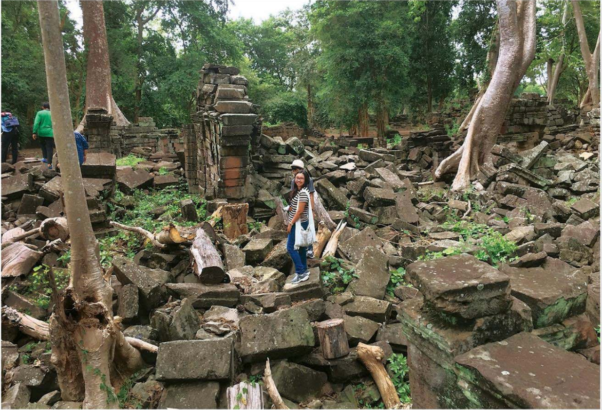
จารึกของปราสาทบันทายจมมาร์

เพราะฉะนั้น สิ่งสำคัญของที่นี่ก็คือ ภาพสลักที่ระเบียงปราสาท เป็นภาพเล่าเรื่องประวัติศาสตร์ในยุคของพระเจ้าชัยวรมันที่ 7 และภาพสลักพระอวโลกิเตศวร