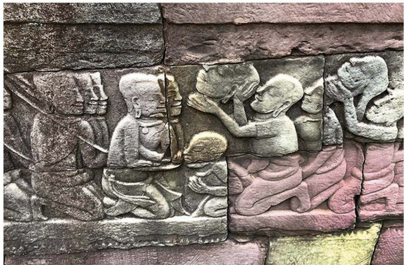
พิพิธภัณฑที่กรุงพนมเปญ

ปางพันกร คือมีพระกรหนึ่งพันกร ในอดีตเคยมีขโมยเข้าไปลักลอบขโมยชิ้นส่วนพระอวโลกิเตศวรนี้ออกมาตามใบสั่ง แต่ไปไม่ถึงไหนมาจับได้ที่ชายแดนประเทศไทย ทางกรมไทยจึงส่งคืนกัมพูชาไป ปัจจุบันชิ้นส่วนเหล่านั้นมีการนำไปจัดแสดงที่