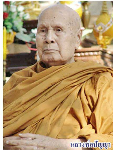
หลวงพ่อปัญญา

ในปี 2560 เป็นเวลาครบ 10 ปีที่หลวงพ่ อปัญญานันทภิกขุรวมภาพ เป็น 10 ปีแห่งความ รักและเคารพที่พวกเราปรารถนาจะรักษาคุณ งามความดีของท่านให้คงอยู่ นั่นคือเราต้องยึด หลักและปฏิบัติตามคำสอนของท่าน และ น้อมใจน้อมกายร่วมกันส่งท่านคืนสู่ธรรมชาติ บัดนี้ กำหนดให้วันที่ 5 พ.ย.2560 เป็นวันแห่ง การสลายสรีระธาตุหลวงพ่อปัญญานันทภิกขุ ได้รับพระมหากรุณาธิคุณจากสมเด็จพระเทพ รัตนราชสุดาฯ สยามบรมราชกุมารี ในการ เสด็จฯ มาพระราชทานเพลิงศพ