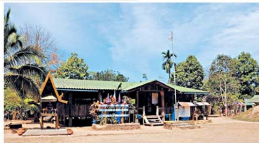
อาหารเรียนที่มีเพียงหลังเดียว