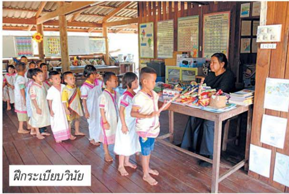
ฝึกระเบียบวินัย