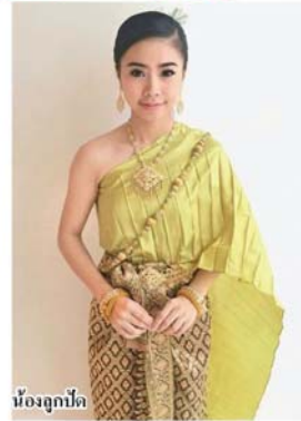
น้องกุกปู้ด

ตัวแทนจากจีน หลาน ซู หง ผอ.ศูนย์วัฒนธรรมแห่งประเทศไทย ที่กรุงเทพมหานคร