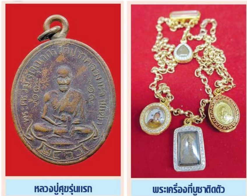
หลวงปู่ศุขรุ่นแรก