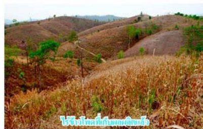
ใช้ไฟป่าพื้นที่เกษตรกรรม