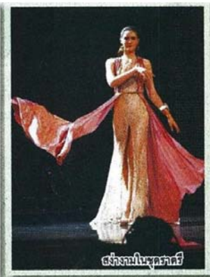
สง่างามในชุดราตรี

ทั้งนี้ หลังจากรับตำแหน่ง มิสทิฟฟานี ยูนิเวิร์ส 2016