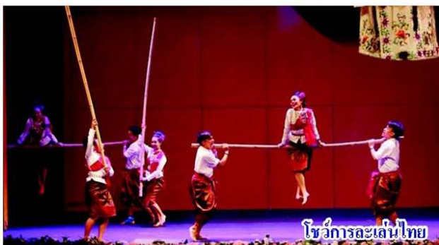
โชว์การละเล่นไทย

จีนลงจากเวทีมายังที่นั่งชมด้านล่าง เพื่อให้ นิสิตมีส่วนร่วมปฏิสัมพันธ์ไปกับการแสดงอย่างใกล้ชิด ตามด้วยการแสดงอุปรากรจีนชุดเปลี่ยนหน้ากาก