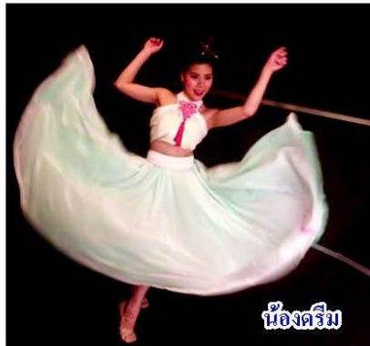
น้องคริม

ขณะที่การแสดงของสาธารณรัฐประชาชนจีนนั้นมาด้วยความสนุก และสร้างความ