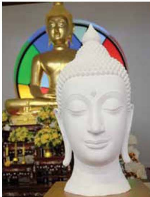
เศียรพระพุทธรูปอันงดงามฝีมืออาจารย์บำรุงศักดิ์ กองสุข ที่พระครูสังฆกิจพิมล (สุรศักดิ์ สุรญาโณ) จัดพิมพ์เผยแพร่มากกว่าล้านแผ่น