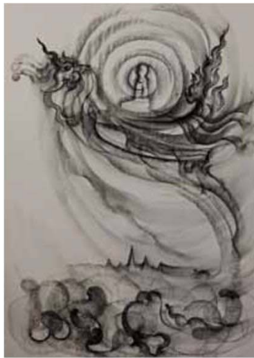
นกหัสติลิงค์ ปาดเศรยงสวด ในงานของ สมยศ คำแสง

นกหัสติลิงค์มีรูปอาจารย์บำรุงศักดิ์นั่งอยู่ข้างใน ส่วนข้างล่างเป็นปฏิมากรรมรูปเทพ เวลเขียนคราวนี้เป็นงานศพนางอวมงคลก็จะปาดเศรยงไปทางซ้ายขวาไปหาทางขวา และเจตนาให้เลื่อนหายไป เพื่อบอกว่า ทุกสรรพสิ่งเกิดมาตั้งอยู่และดับไป ส่วนงานที่จัดแสดงส่วนใหญ่เป็นงานของอาจารย์และลูกศิษย์ที่มาเรียนรู้เรื่องประติมากรรมไทยเป็นเรื่องที่ดีที่มีนิทรรศการศิลปะในงานศพ คนมาร่วมงานจะได้ดูงานศิลปะได้ระสอระจิบ ได้เรียนรู้ธรรมอีกด้วย”