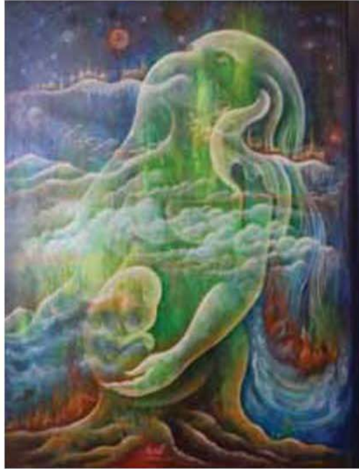
กำเนิดธาตุ ผีมือสลาวารินทร์ ใจจรรยทีก

ปัญญาย่อมเก็บเกี่ยวปัญญานั้นได้เสมอ “ขอบคุณที่มาส่งเรา” งานศิลปะที่ก่อเกิด ปัญญาออกงามแก่สังคม