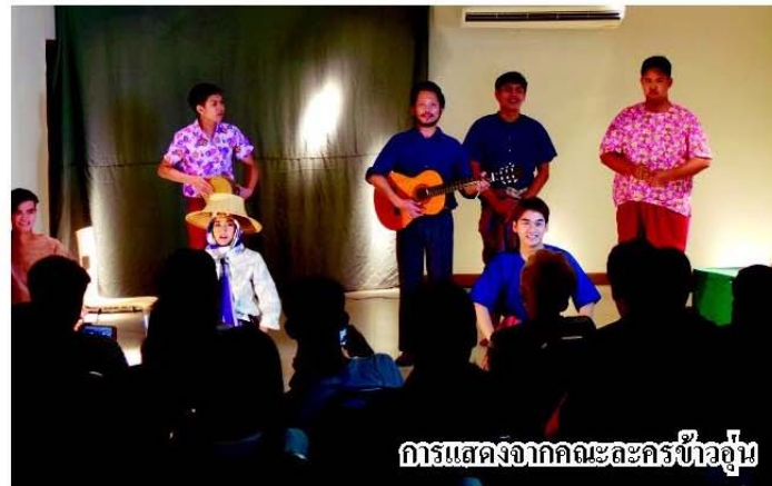
การแสดงจากละครข้าวอุ่น

ภายหลังการเสวนาปิดท้ายด้วยการแสดงละครเวทีเรื่อง “ขอให้การพายเรือของเจ้าเทียวนี้จงเป็นเที่ยวสุดท้าย” จากคณะละครข้าวอุ่น คณะศิลปกรรมศาสตร์ มหาวิทยาลัยศรีนครินทรวิโรฒ ซึ่งถ่ายทอดประเด็นชนชั้นล่างในสังคมที่อยู่อย่างมีเกียรติศักดิ์ศรี เป็นหนึ่งในเรื่องสั้นเรื่องสุดท้ายที่ลุงเสได้เขียนไว้เมื่อปี 2543