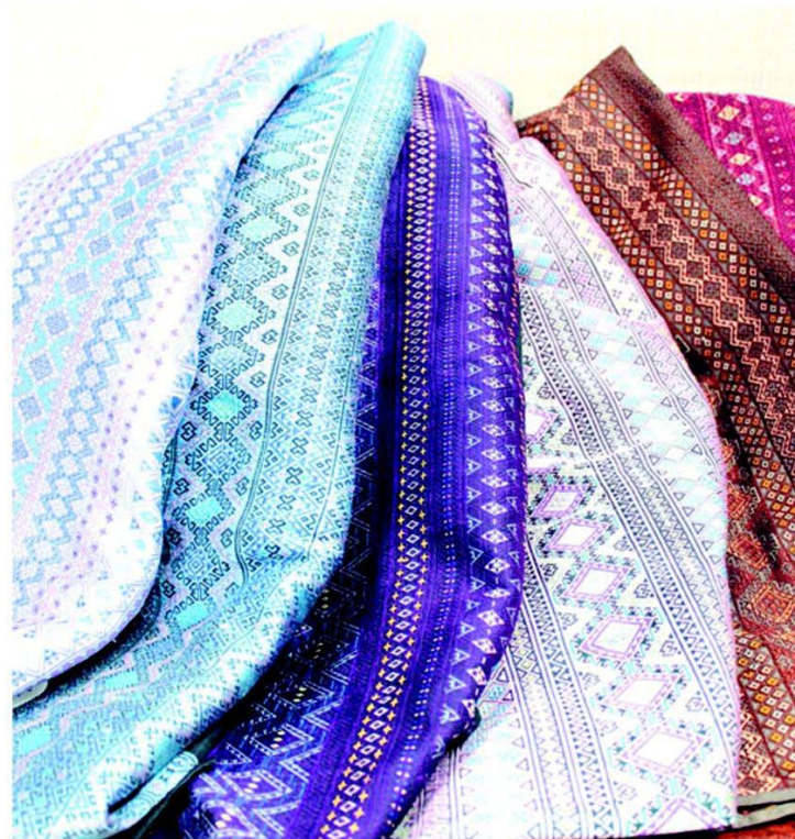
ผ้าจากไหม จากมูลนิธิส่งเสริมศิลปาชีพ