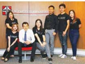
มหาวิทยาลัยเกษตรศาสตร์ มหาวิทยาลัยรัตนบัณฑิต และ มหาวิทยาลัยศรีนครินทรวิโรฒ

ในแต่ละปีสมาคมฯ จะทำกิจกรรมใน 3 ส่วนหลักๆ ที่กล่าวมา เริ่มจากในเดือนกันยายน-ตุลาคม 2557 เปิดรับนักศึกษาและคัดเลือกให้เข้ามาทำกิจกรรมเพื่อสร้างความรู้จักซึ่งกันและกัน