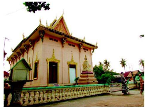
วัดพระพุทธไสยาจารย์ ที่กรุงพนมเปญ เจ้าพระยาบดินทรเดชาเคยปฏิสังขรณ์ไว้ พบจารึกเรื่องการบูรณะวัดเป็นภาษาไทย

ตอนนั้นที่วังหน้าปราบเวียงจันทน์ได้แล้ว เจ้าอนุวงศ์หนีไปเวียดนาม กลายเป็นว่าเวียดนามให้ท้ายทั้งลาวและกัมพูชาในสายตาของไทย