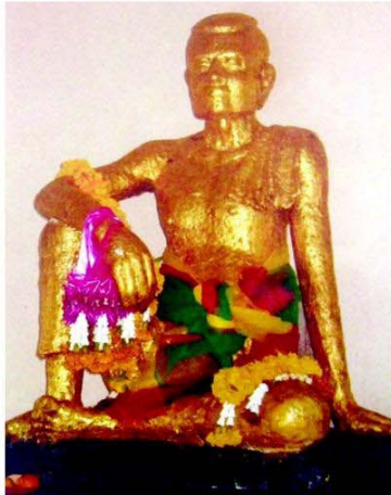
รูปหล่อเจ้าพระยาบดินทรเดชา ที่วัด จักรวรรดิราชาวาส กรุงเทพฯ ถอดแบบมา จากรูปปั้นที่เมืองอุดงจิมขัย