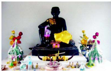
เจ้าพระยาบดินทรเดชาในศาลวัดแจ้ง ปราจีนบุรี