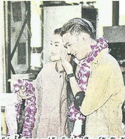
โด่งนำตาลลอ แม่อ้อมโผล่เซอร์ไพรส์วันเปิดตัว

เป็นนักร้องนะ ต้องเล่นกีตาร์ ต้องเป็นนักดนตรี แต่ที่เขา เลือกเดินบนเส้นทางสายนี้ อาจเป็นเพราะว่าเขาเห็นในสิ่งที่ เราทำมาโดยตลอด และมีความต้องการทำสิ่งที่พ่อแม่ทำแล้ว ก็ทำได้ดีด้วย ตอนนี้เขาเล่นดนตรีได้เก่ง เรียนดนตรีโดยตรง มาถึงวันนี้ผมคิดว่าเป็นก้าวแรกที่ดี มีความสุขที่ได้เห็นสายเลือด ใหม่เข้ามามีบทบาท ผมเชื่อว่าเด็กสมัยนี้มีความสามารถมากกว่ารุ่นพ่อรุ่นแม่ด้วยซ้ำ”