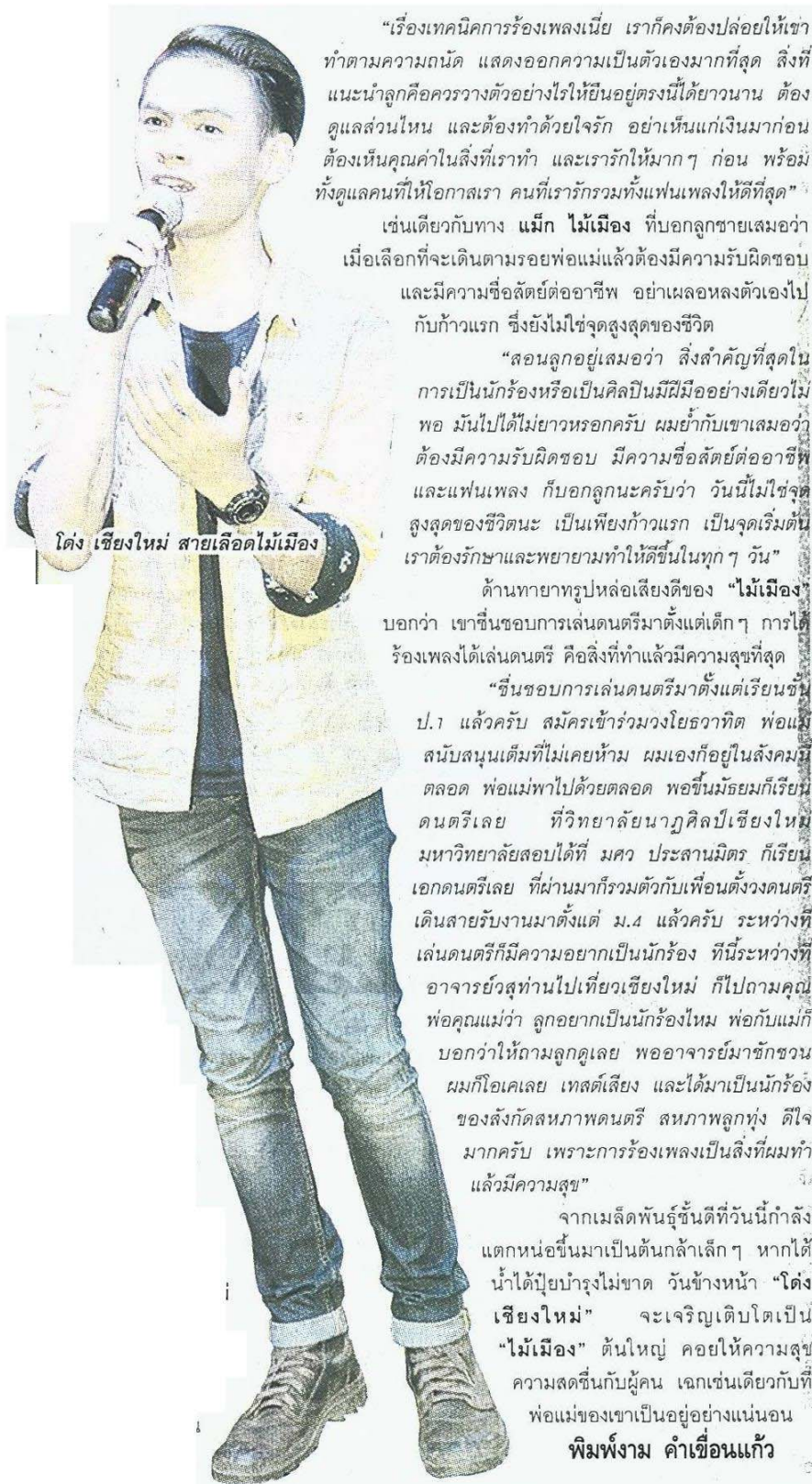
โด่ง เชียงใหม่ สายเลือดไม้เมือง

“เรื่องเทคนิคการร้องเพลงเนี่ย เราก็คงต้องปล่อยให้เขาทำตามความถนัด แสดงออกความเป็นตัวเองมากที่สุด สิ่งที่น่ากลัวคือควรวางตัวอย่างไรให้ยืนอยู่ตรงนี้ได้ยาวนาน ต้องดูแลส่วนไหน และต้องทำด้วยใจรัก อย่าเห็นแก่เงินมาก่อน ต้องเห็นคุณค่าในสิ่งที่เราทำ และเรารักให้มาก ๆ ก่อน พร้อมทั้งดูแลคนที่ให้โอกาสเรา คนที่เรารักรวมทั้งแฟนเพลงให้ดีที่สุด”