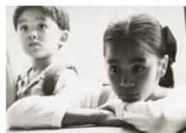
กาลครั้งหนึ่งเมื่อเช้า