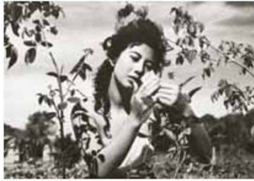
รักริษยา

นางนาก (2542) กาลครั้งหนึ่งเมื่อเช้านี้ (2537) กลิ้งไว้ก่อนพ่อสอนไว้ (2534) คนเลี้ยงช้าง (2533) คนทรงเจ้า (2532) ลำเพ็ง (2525) ตลาดพรหมจารีย์ (2516) รักริษยา (2500) เศรษฐีอนาถา (2499)