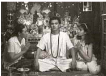
สันติ-วิธนา

ที่สะท้อนวิถีชีวิต ความเป็นอยู่ สภาพเศรษฐกิจ สังคม ในช่วงเวลานั้นๆ อย่างชัดเจน ภาพยนตร์ จึงนับเป็นมรดกวัฒนธรรมที่มีคุณค่าของชาติ” “นอกจากนี้ ขอขอบคุณประชาชนที่มีส่วนร่วม โดยการเสนอชื่อภาพยนตร์เรื่องต่างๆ เข้ามาให้ คณะกรรมการพิจารณาด้วย เพราะการอนุรักษ์ มรดกใดๆ ของชาติ ไม่ควรเป็นเพียงหน้าที่ของ หน่วยงานหรือบุคลากรของรัฐโดยลำพัง แต่จำเป็น จะต้องให้สาธารณชนได้รับรู้ ตระหนัก และมี ส่วนร่วม ไม่ว่ามากหรือน้อย การอนุรักษ์มรดก ของชาติ จึงจะสำเร็จและยั่งยืน เกิดความรู้สึ กหวงแหนและภาคภูมิใจร่วมกัน”