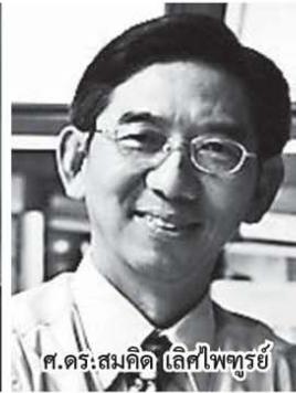
ศ.ดร.สมคิด เลิศไพฑูรย์