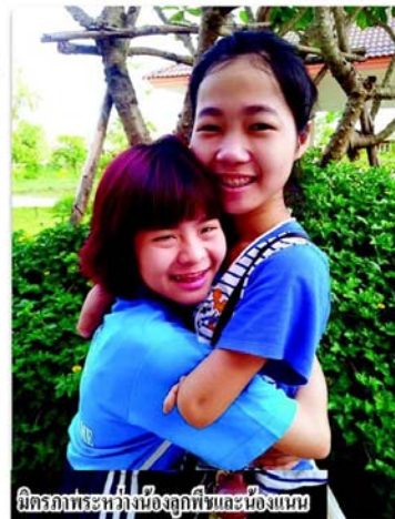
มิตรภาพระหว่างน้องอุกฤษและน้องแนน

แต่เขาใช้ชีวิตมาก ทำให้ตัวเองเกิดกำลังใจอย่างประหลาด เรามีโอกาส