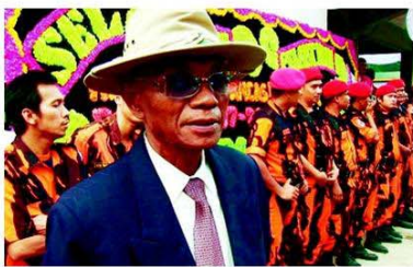
เหตุการณ์ลอบสังหารนายพลฝ่ายขวา โดย นายทหารของซูการ์โนเอง ส่งผลต่อคะแนน