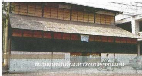
สนามแบดในตึกมหาวิทยาลัยขอนแก่น