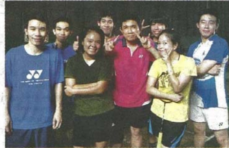
บรรดานักแบดฯ ช่วยถ่ายภาพกันอย่างมีความสุข

ปัจจุบันถ้าเอ่ยชื่อกีฬาชนิดหนึ่งที่ชาวคนไทยนักเรียน นักศึกษา นิยมเล่นกัน "กีฬาแบดมินตัน" จะเป็นกีฬาที่อยู่ในใจของคนรุ่นใหม่ เป็นเพราะว่ากระแส "น้องเมย์" จิกชนก อินทนนท์ ยังเป็นไอดอลของคนไทยทุกคน และเมื่อวันที่ 14-22 ม.ค. 2557 "น้องเมย์" ได้เข้าร่วมการแข่งขันกีฬามหาวิทยาลัยแห่งประเทศไทย ครั้งที่ 41 ที่ ม.ขอนแก่น ซึ่งเป็นที่สนใจของคนทั่วไป และหลังจากเสร็จสิ้นการแข่งขัน ทำให้สนามแบดมินตันสังกะสี...มีนักศึกษาเข้าไปเล่นแบดมินตันเพิ่มขึ้น