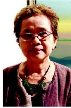
ชมัยกร แสงกระจ่าง