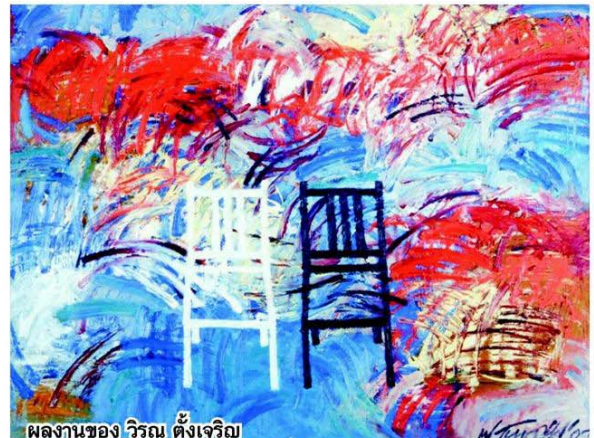
ผลงานของ วิรุณ ตั้งเจริญ

สิทธิธรรม โรหิตะสุข กัณฑ์การกัณฑ์นทรศการครั้งนี้ กล่าวว่าการนำผลงานจิตรกรรมของนิทรรศการกลับมาจัดแสดงใหม่อีกครั้งนั้น น่าจะมีการพัฒนา ต่อยอด และสร้างความหมายที่แตกต่างออกไปให้มีความ