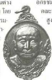
เทวี่บุญของหัวเมืองมณฑล