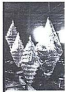
โคมไฟเจดีย์

ศูนย์สารสนเทศและการประชาสัมพันธ์ ได้จัดระบบข่าวสิ่งพิมพ์ สนใจดูที่ได้ http://news.swu.ac.th/newsclips/