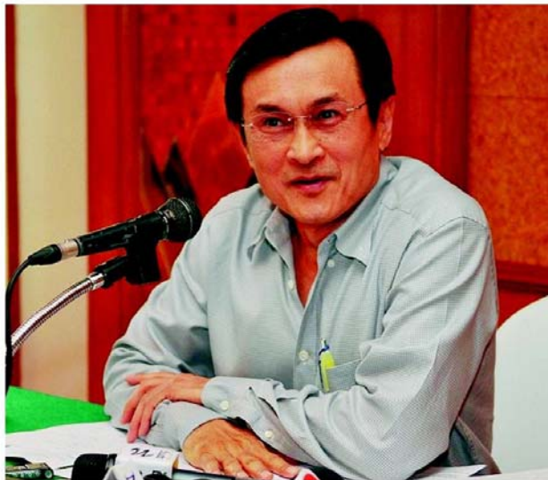
จาตุรนต์ ฉายแสง

“นายจาตุรนต์เคยเป็นรัฐมนตรีว่าการ คส.มาแล้ว เชื่อว่าจะสานต่อจากนายพงศ์เทพ คือ การคืนความเป็นธรรมให้กับข้าราชการในอุดมศึกษา ที่เงินเดือนต่ำกว่าครูสังกัดสำนักงานคณะกรรมการการศึกษาขั้นพื้นฐาน (สพฐ.) อยู่ 8% ซึ่งเรื่องนี้นายพงศ์เทพได้ดำเนินการมาระดับหนึ่งแล้ว ขณะเดียวกันอยากให้พิจารณาเรื่องการแยกกระทรวงอุดมศึกษาและวิจัย เพราะขณะนี้ประชุมอธิการบดีแห่งประเทศไทย (ทปอ.) กำลังทำการวิจัยถึงข้อดี ข้อเสีย ตั้งแต่มีการรวมโครงสร้าง ซึ่งพบว่ามีปัญหาในเรื่องการบริหารจัดการที่ไม่คล่องตัว และมีแนวโน้มว่าทปอ.จะยื่นข้อเสนอแยกเป็นกระทรวงอุดมศึกษาและวิจัยแน่นอน ส่วนในภาพรวมอยากให้เห็นหน้าเรื่องการปฏิรูปการศึกษา โดยเฉพาะการปฏิรูปหลักสูตร เพราะถือเป็นสัญญาณที่ดี ที่จะทำให้เกิดการเปลี่ยนแปลงการศึกษาทั้งระบบ”