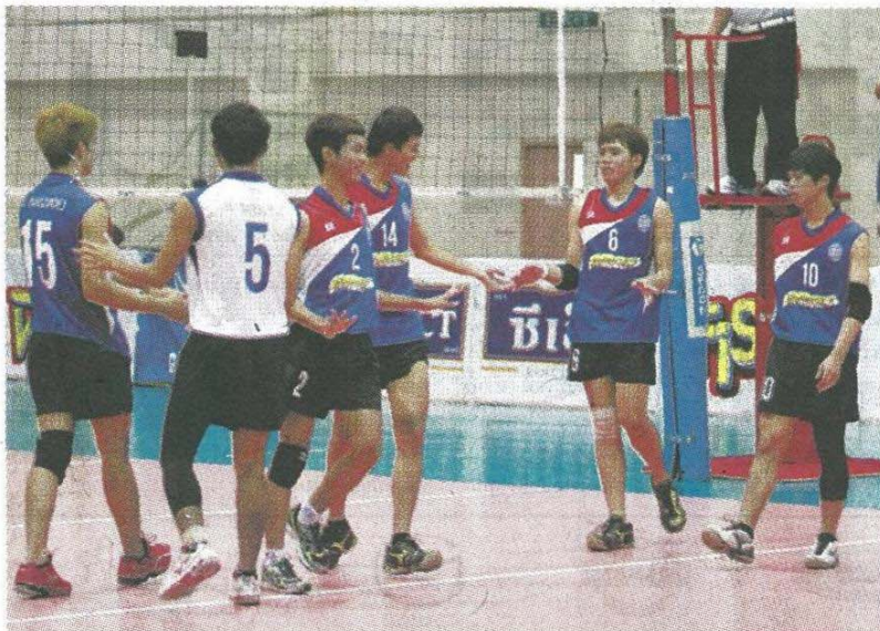
แพ่ทหาร ทีมนักตบลูกชายชายสโมสรวอลเลย์บอลบ้านสมเด็จพระเจ้าตากสินมหาราชชนะทีมมทบ.11 และ ร.ร.กีฬาอ่างทอง 0-3 เซต

ร.ร.กีฬาอ่างทอง ชนะ 1 แพ้ 1, สาย ข ปากน้ำโพ วิชัย ชนะ อาร์-เค 3-0 (25-10, 25-14, 25-10) ใช้เวลา 45 นาที ทำให้ ปากน้ำโพ เก็บชัยชนะเป็นนัดที่ 2 นำอันดับที่ 1 และ อาร์-เค แพ้รวด 2 นัด รั้งบ๊วยสาย ข