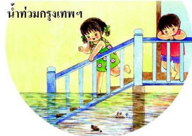
น้ำท่วมกรุงเทพฯ

ทรงยศ สยามกษัตริย์ ผู้จัดการศูนย์หนังสือจุฬาฯ กล่าวว่านิทานเป็นกุศโลบายชั้นเยี่ยม