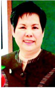
ป่ากูด รต.กุลธรรว

ศูนย์หนังสือจุฬาลงกรณ์มหาวิทยาลัย ในฐานะผู้จัดจำหน่ายหนังสือชุดนิทานบ้าน