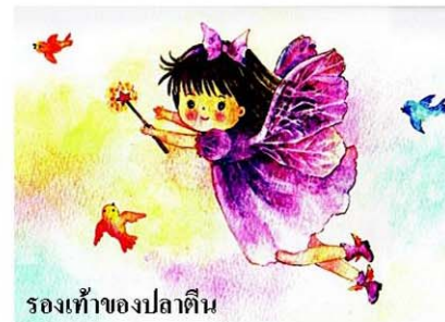
รองเท้าของปลาตีน

ป่ากุดทิ้งท้ายด้วยว่า “การอ่านนิทานนอกจากจะทำให้ได้รับความรู้และเพลิดเพลินใจแล้ว เด็กๆ ยังได้รับข้อคิดและคุณธรรมที่เกิดจากการบ่มเพาะของนิทานฝังไว้ในจิตใจ”