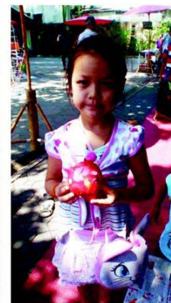
กระปุกหมูของหนูค่ะ