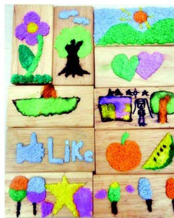
ดินกระดาษ