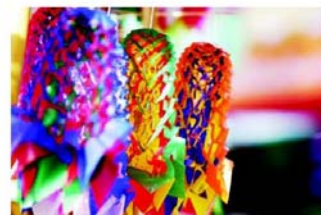
พวงมะโหตร

เชียงใหม่-วัดสระเกษ ชุมชนสิทธารามและกลุ่มดินน้ำมัน ระบายสีหน้ากากงิ้ว ศิลปะตัดกระดาษจีนย่านเยาวราช หัดทำว่าว โบายกระดาษโดยโรงเรียนวัดถิ่นคลองลัดมะยม