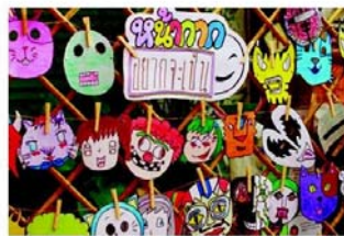
ผลงานหน้าฉากกระดาษของเด็กๆ

เด็กๆ ครอบครัวยุคใหม่ จะได้สนุกสนานเบิกบานใจกับ "มหกรรมกระดาษแปลงร่างสร้างเมืองยิ้ม" จากชุมชนต่างๆ เช่น ไปสการ์คือป๊อป-อัท ป้อมพระศุภร ชุมรมเกสรลำพู หมู่กระปุกอมรัก ชุมชนย่านกะดีจีน ตุ๊กตากระดาษเยาวชนแพร่งภูธร การ์ดแปลงร่างชุมชนบ้านบาตร ชุมชนตรอก