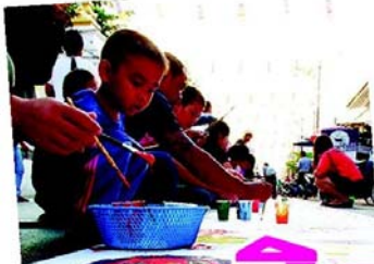
ศิลปะบนถนน