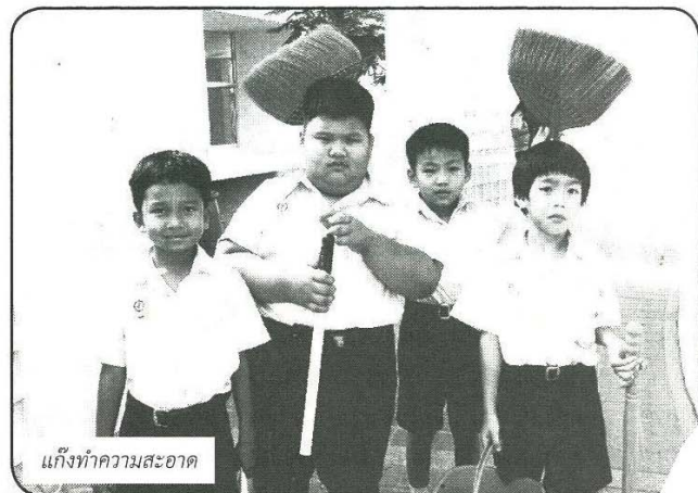
แก๊งทำความสะอาด

ทำ เด็กๆ รู้สึกสนุก ในการทำกิจกรรม จนทำให้ผู้ปกครอง รู้สึกภูมิใจที่จากเดิม เด็กไม่เคยทำความ