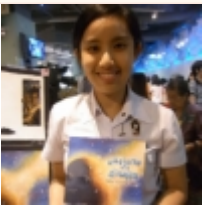
กัลยรัตน์