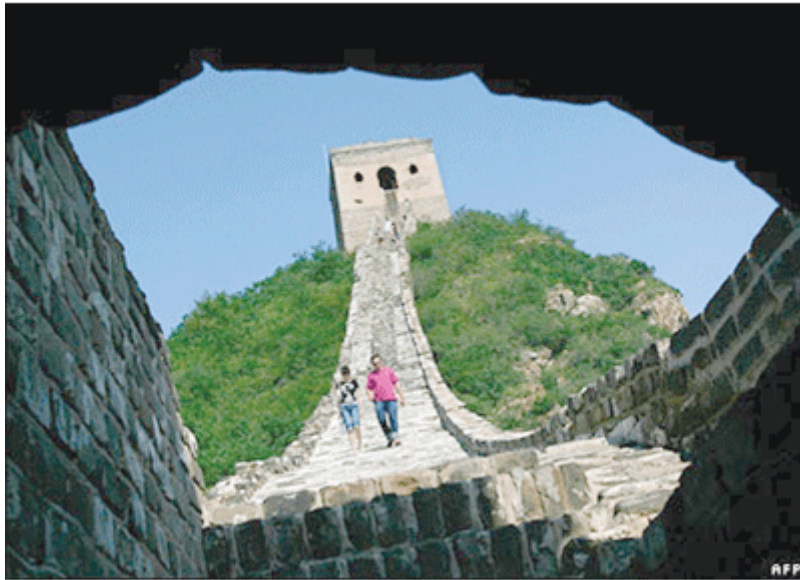
กำแพงเมืองจีน