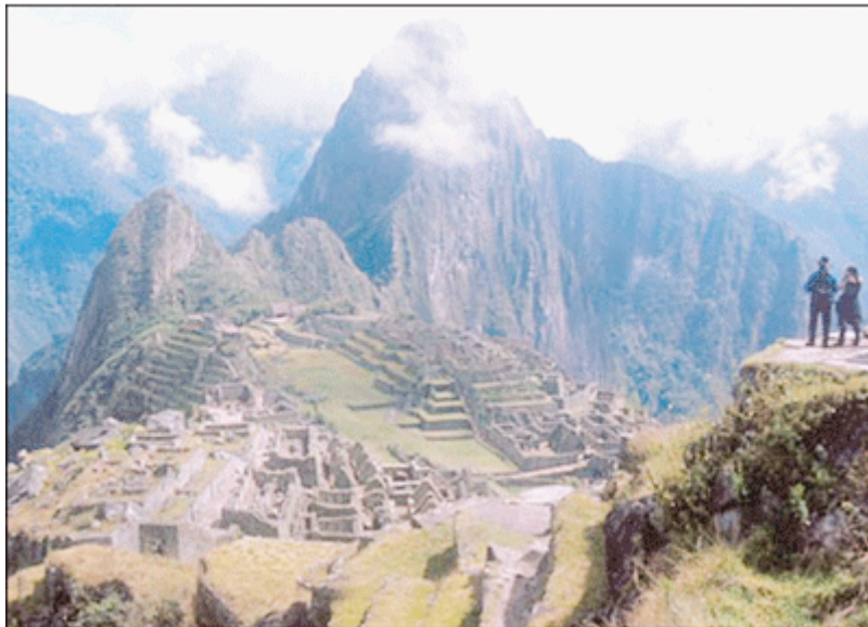
อาณาจักรอินคา มาชูปิกชู ในเปรู