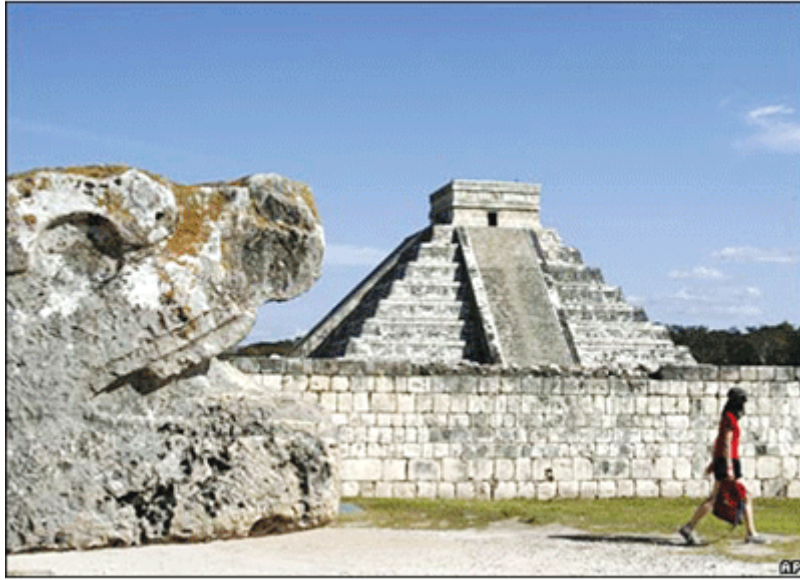
ชิเชนอิตตา ในเม็กซิโก