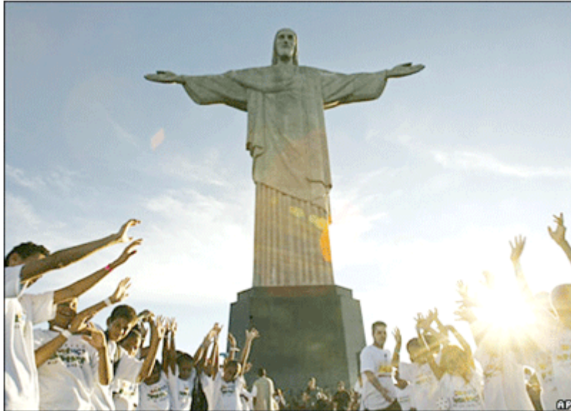
รูปปั้นพระเยซูขนาดใหญ่ ในริโอเดอจาเนโรของบราซิล