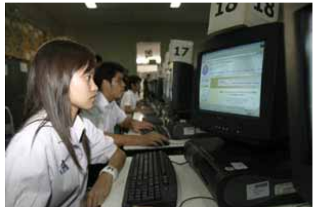
บรรยากาศความวุ่นวายในการตรวจคะแนนโอนเน็ต-เอเน็ตเมื่อปีที่แล้ว

ถึงเวลานี้ ศ.ดร.อุทุมพร พร้อมแค่ไหนสำหรับการจัดสอบที่จะมีขึ้นในช่วงปลายเดือนนี้