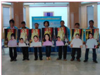
อาสาสมัคร 7 คน

ปัจจุบันจำนวนของผู้สูบบุหรี่จากสำนักงานสถิติแห่งชาติ เมื่อปี 2547 ระบุว่า ผู้ที่สูบบุหรี่มีอายุมากกว่า 15 ปีขึ้นไป มีจำนวนผู้สูบบุหรี่ 11.3 ล้านคน เป็นผู้สูบบุหรี่ประจำ 9.6 ล้านคน และผู้สูบบุหรี่นาน 1.4 ล้านคน จากประชากรทั้งสิ้น 49.45 ล้านคน