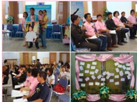
(ซ้ายบน) นายนิทัศน์ (ขวาบน) แลกเปลี่ยนประสบการณ์ (ซ้ายล่าง) บรรยายภาคงานแถลงข่าว

หมากฝรั่งเลิกบุหรี่หนึ่งแผ่นจะมี 9 เม็ด สามารถออกฤทธิ์ได้นานประมาณ 40-60 นาที ซึ่งเท่ากับบุหรี่หนึ่งมวนนั่นเอง