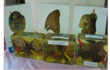
มะเร็งปอด