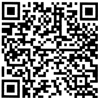
QR Code วิธีการลงทะเบียน และการรับสมัคร