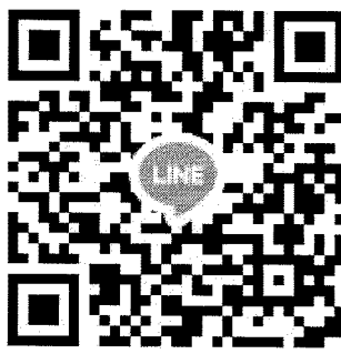
QR Code สำหรับผู้สมัคร สแกนเข้ากลุ่มไลน์