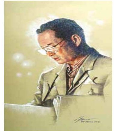
ภาพการทรงงานที่คุ้นตาคนไทย

หลังจากนั้นไปเรียนต่อที่มหาวิทยาลัย ศรีนครินทรวิโรฒแม้จะเรียนในทางการ ศึกษาแต่ก็ยังวาดรูปในหลวงอยู่ตลอด และเมื่อจบออกมาทำงานในสายงาน โฆษณาแต่ก็ทำงานทางด้านศิลปะ กลับ จากทำงานถึงบ้านหนึ่งทุ่มก็เป็นเวลาของ การวาดรูปและจะวาดรูปในหลวงเป็นหลัก ถึงวันนี้นับว่าเขียนมาไม่น้อยกว่า 500 ภาพ ทั้ง ครอบอึ้งด้วยดินสอ แท่งถ่านเคระยอง สีน้ำ สีน้ำมัน และดีจิตอล ก็เขียน มีคนถามอยู่เสมอว่าทำไมถึง เขียนรูปในหลวงมากขนาดนี้ ก็ตอบได้