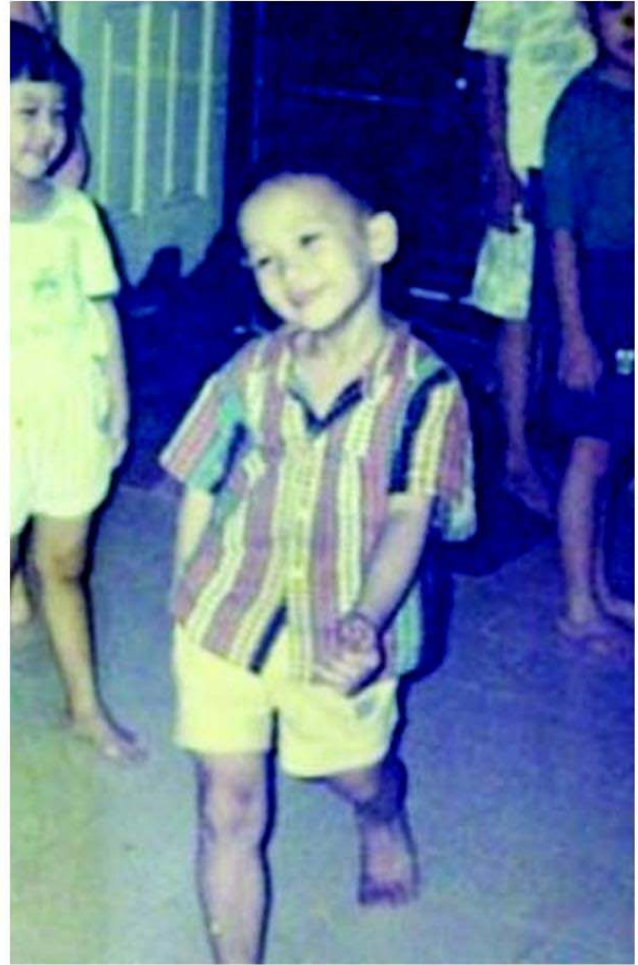
ด.ช.อัศวพล

“พ่อคงรู้พฤติกรรมของโม่ตั้งแต่เด็กๆ แล้วค่ะ แต่เขาแค่อยากให้โม่อยู่ในลูในทาง หรือในกรอบที่เขาวางไว้ ซึ่งพ่อไม่อยากให้อยู่กับ