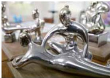
▲ ตัวอย่างผลงานออกแบบสัญลักษณ์ การ นวดตัว ที่นำมาต่อยอดเป็น ประติมากรรมขนาดเล็ก

ตัวอย่างงานออกแบบที่ทำให้อาคารของกรม พัฒนาการแพทย์แผนไทยมีเอกลักษณ์แตกต่าง จากอาคารที่อยู่ในละแวกใกล้เคียง แสดง พื้นที่จำเพาะของการแพทย์แผนไทย ผมจึง ได้สร้างประติมากรรมวอลลัส อาร์ต และ หม้อยาขึ้นมา ติดตั้งที่บริเวณหน้าจั่วของ ผนังอาคาร และพื้นที่หน้าอาคาร”