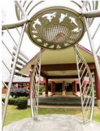
▲ สวดสายฉลุที่สื่อถึงอัตลักษณ์ของ การแพทย์แผนไทย