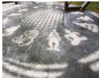
▲ เมฆประติมากรรมที่ตกสะเก็ดอ่อน

เสาอาคาร เพื่อติดตั้งสายตาผู้มาเยือนให้ สะดุดและหยุดพิจารณา