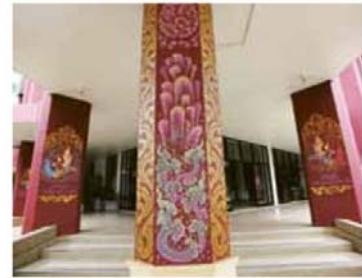
▲ จิตรกรรมประดับเสาอาคาร

“ในงานออกแบบเราต้องคิดถึงใจ กลุ่มเป้าหมาย หรือผู้บริโภคเมื่อเราคิดถึง แล้วเราก็ผลักดันส่วนที่เป็นศิลปกรรม