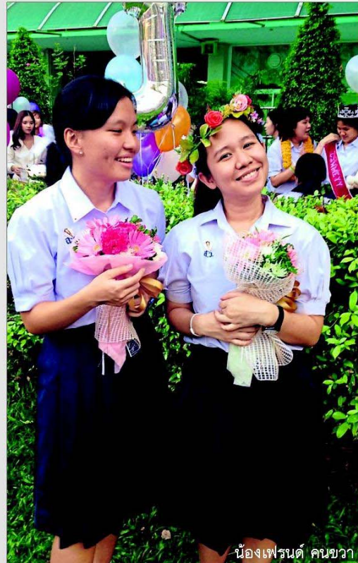
น้องเฟรนด์ คนขวา

แม้ว่าจะเป็นช่วงสอบ “จิ๊บ” ก็อ่านหนังสือไม่หนักมาก เพราะเธอไม่อยากจะเกิดความเครียดกับตัวเองมากเกินไป และคิดว่าหากเราตั้งใจเรียนในห้องเรียนจะทำให้การอ่านหนังสือของเราเข้าใจเนื้อหามากขึ้น หากไม่เข้าใจเนื้อหาส่วนไหนก็จะมุ่งอ่านบทนั้นเป็นพิเศษ