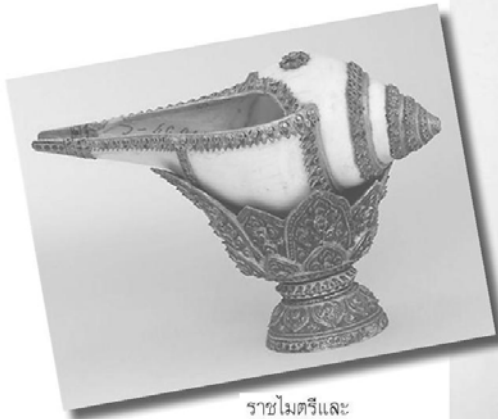
ราชไมตรีและ เครื่องมงคลราช บรรณาการใน รัชกาลที่ 4” ใน งานนี้จะมีทั้งนัก วิชาการและผู้มีความ

พระมหามงกุฏ เครื่องมงคลราชบรรณาการ พ ในรัชกาลที่ 4 ที่พระราชทานแด่พระเจ้า นโปเลียนที่ ๓ แห่งฝรั่งเศส ที่หายไปจาก พิพิธภัณฑ์ภายในพระราชวังฟงแตนโบล กรุง ปารีส ประเทศฝรั่งเศส เนื่องจากมีโจรบุกเข้า โจรกรรมกลางวันแตกๆ สร้างความฮือฮาไปทั่ว โลก และเป็นเหตุให้กรมศิลปากรจัดงานเสวนา ทางวิชาการในหัวข้อ “พระ